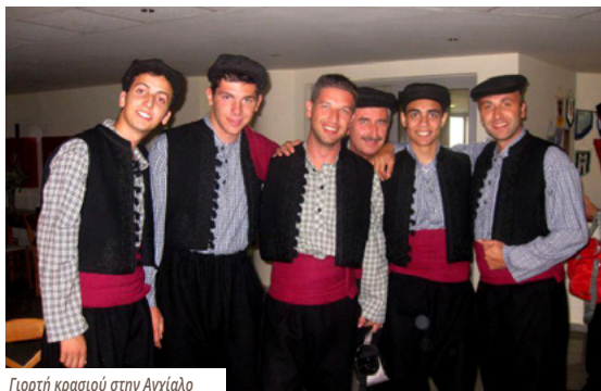
Γιορτή κρασιού στην Αγχιάλο