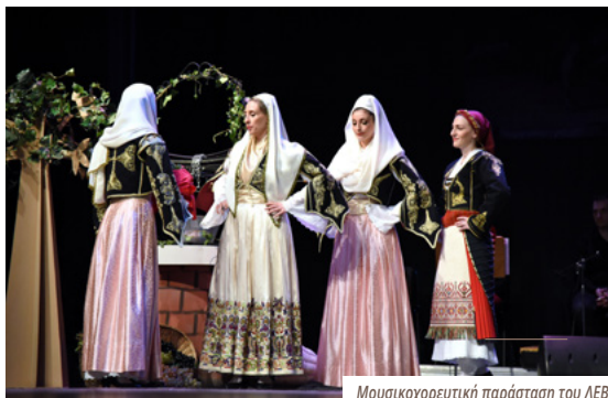
Μουσικοχορευτική παράσταση του ΛΕΒ