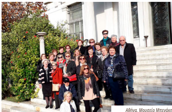
Αθήνα, Μουσείο Μπενάκη