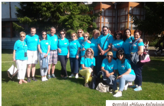
Φεστιβάλ «Ρόδων» Καζανιούκ