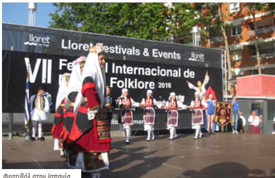
Φεστιβάλ στην Ισπανία