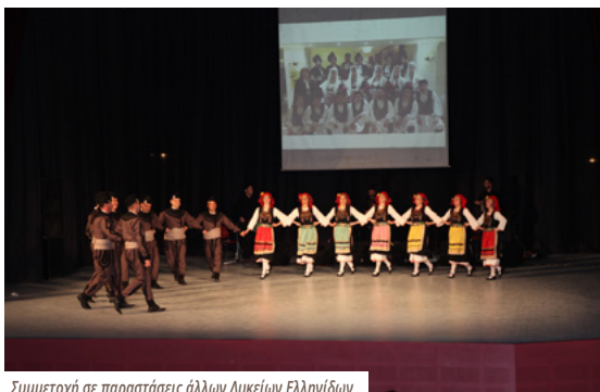
Συμμετοχή σε παραστάσεις άλλων Λυκείων Ελληνίδων