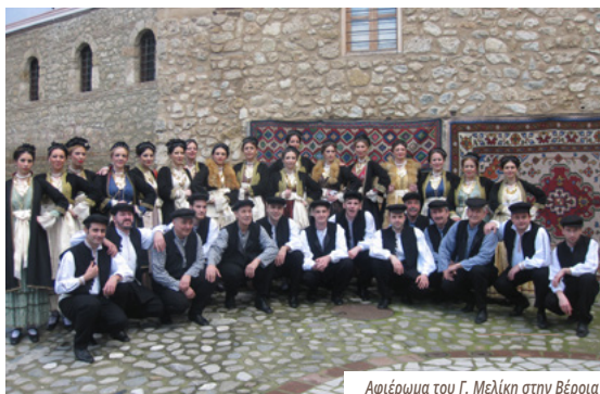
Αφιέρωμα του Γ. Μελίκη στην Βέροια