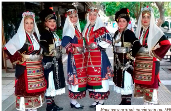
Μουσικοχορευτική παράσταση του ΛΕΒ