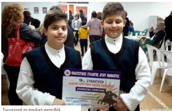
Συμμετοχή σε παιδικό φεστιβάλ