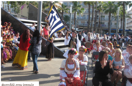
Φεστιβάλ στην Ισπανία