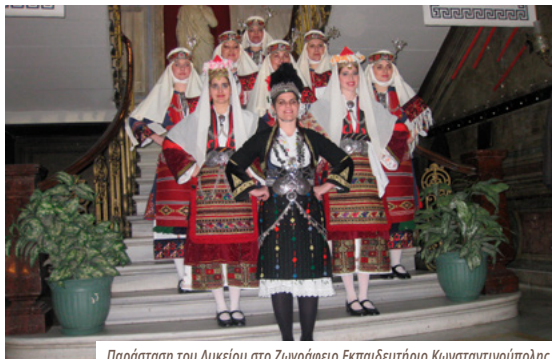
Παράσταση του Λυκείου στο Ζωγράφειο Εκπαιδευτήριο Κωνσταντινούπολης