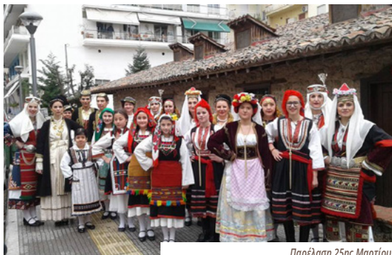
Παρέλαση 25ης Μαρτίου