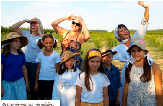
Φωτογράφιση για ημερολόγιο