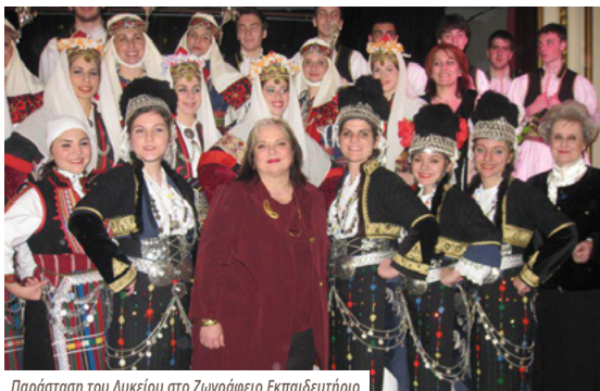
Παράσταση του Λυκείου στο Ζωγράφειο Εκπαιδευτήριο