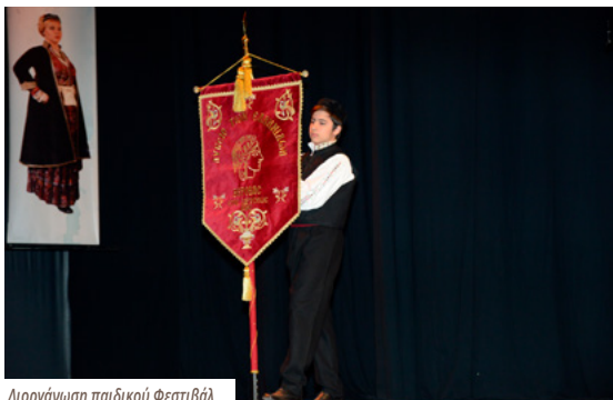
Διοργάνωση παιδικού Φεστιβάλ