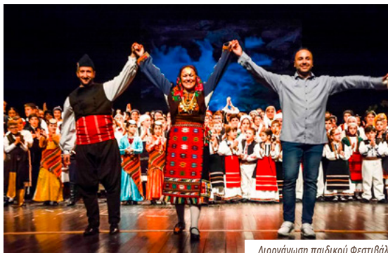
Διοργάνωση παιδικού Φεστιβάλ