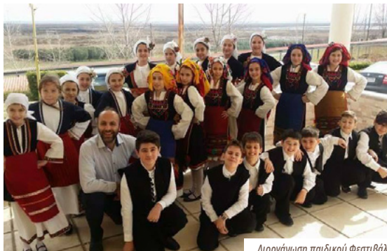
Διοργάνωση παιδικού Φεστιβάλ