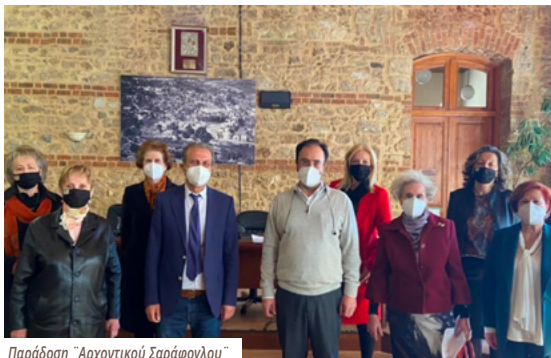
Παράδοση "Αρχοντικού Σαράφογλου"