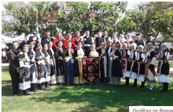
Ελευθέρια της Βέροιας