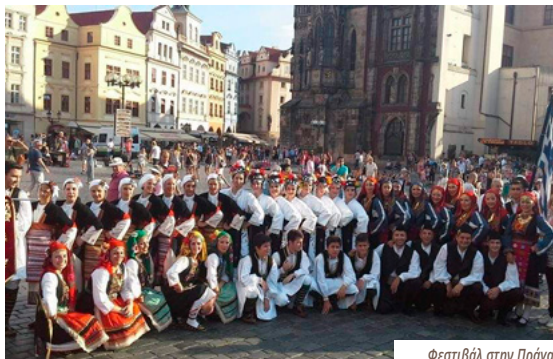
Φεστιβάλ στην Πράγα