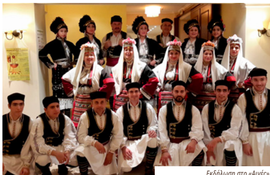
Εκδήλωση στο «Αιγές»