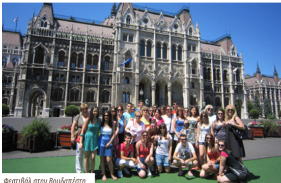
Φεστιβάλ στην Βουδαπέστη