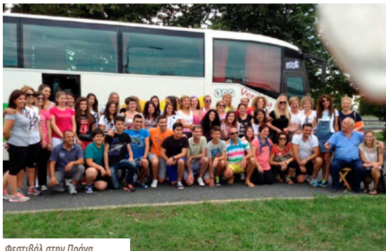
Φεστιβάλ στην Πράγα