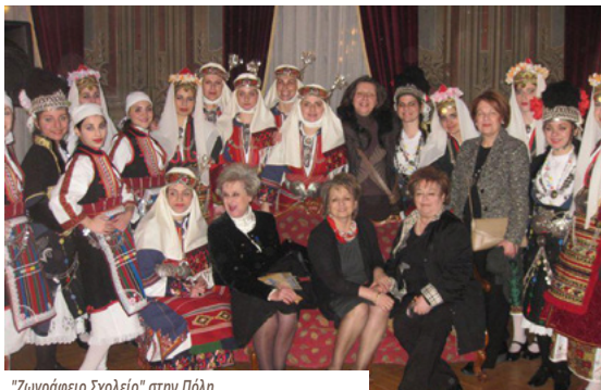
"Ζωγράφειο Σχολείο" στην Πόλη