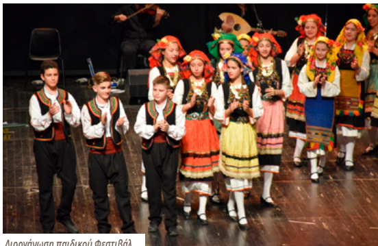
Διοργάνωση παιδικού Φεστιβάλ