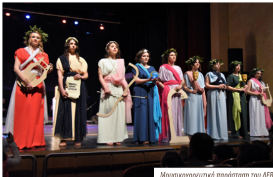
Μουσικοχορευτική παράσταση του ΛΕΒ