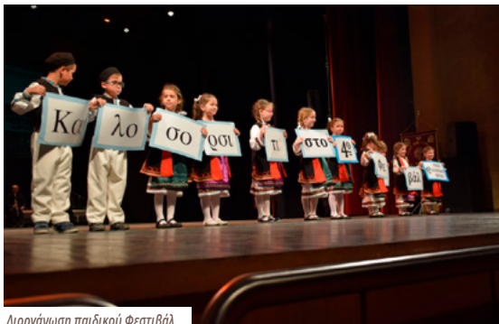
Διοργάνωση παιδικού Φεστιβάλ