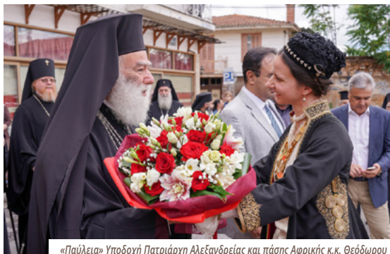
«Παύλεια» Υποδοχή Πατριάρχη Αλεξανδρείας και πάσης Αφρικής κ.κ. Θεόδωρου