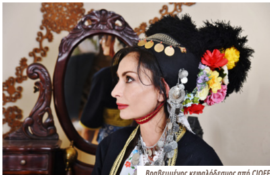
Βραβευμένος κεφαλόδεσμος από CIOFF