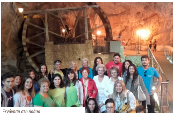
Ξεναγήση στη Δράμα