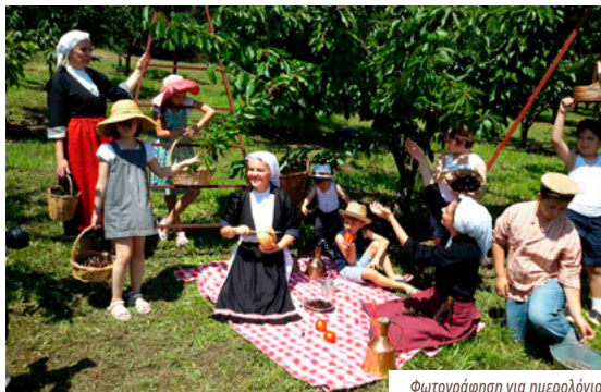
Φωτογράφιση για ημερολόγιο