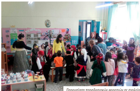
Παρουσίαση παραδοσιακών φορεσιών σε σχολείο