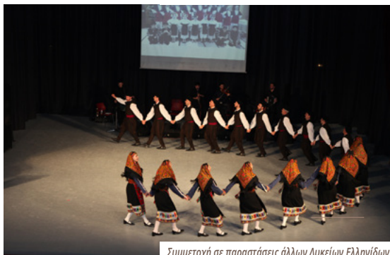
Συμμετοχή σε παραστάσεις άλλων Λυκείων Ελληνίδων