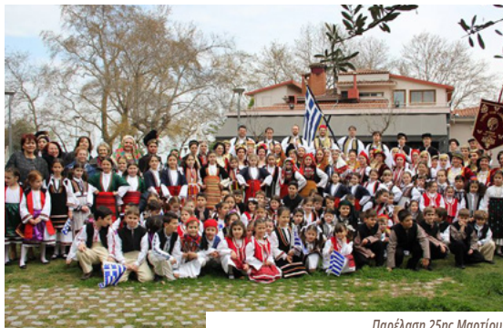
Παρέλαση 25ης Μαρτίου