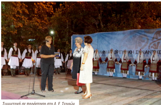
Συμμετοχή σε παράσταση στο Λ. Ε. Σερρών