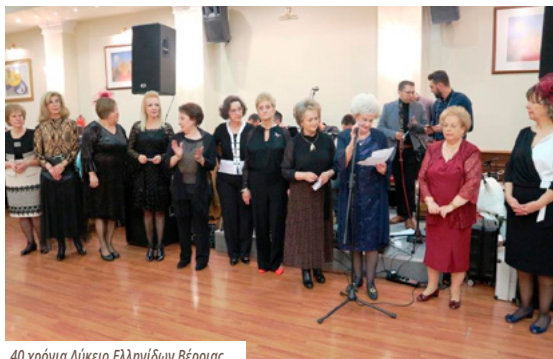
40 χρόνια Λύκειο Ελληνίδων Βέροιας