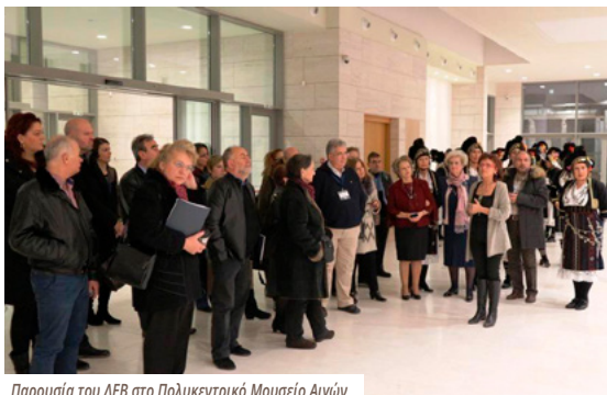
Παρουσία του ΛΕΒ στο Πολυκεντρικό Μουσείο Αγίων