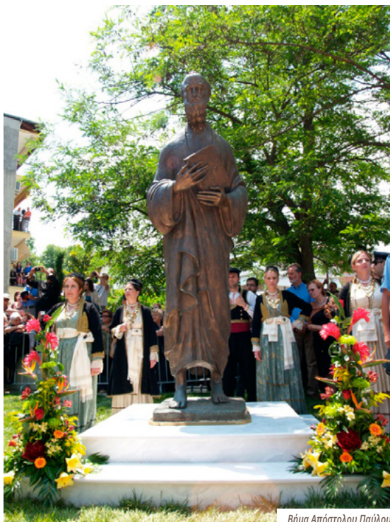
Βήμα Απόστολου Παύλου