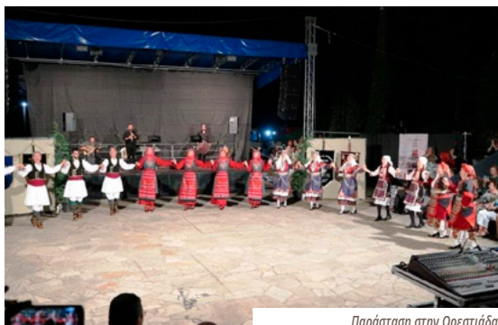
Παράσταση στην Ορεστιάδα