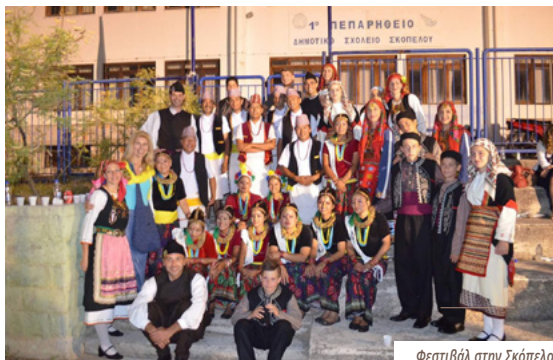
Φεστιβάλ στην Σκόπελο