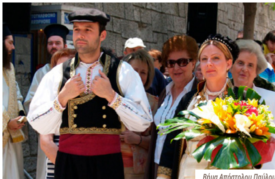
Βήμα Απόστολου Παύλου