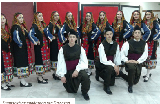
Συμμετοχή σε παράσταση στα Γιαννιτσά