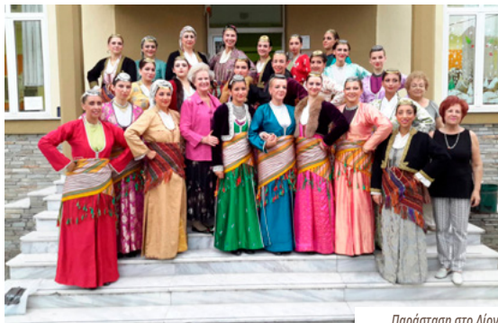
Παράσταση στο Δίον