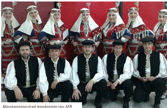
Μουσικοχορευτική παράσταση του ΛΕΒ