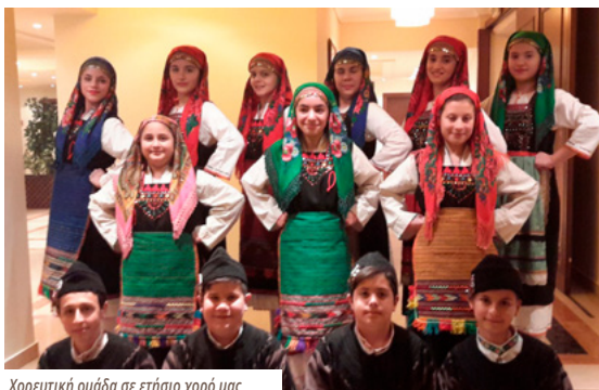
Χορευτική ομάδα σε ετήσιο χορό μας