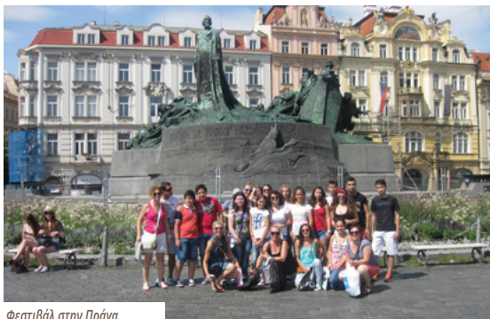
Φεστιβάλ στην Πράγα