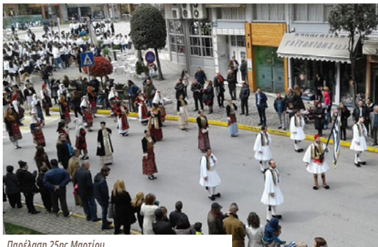
Παρέλαση 25ης Μαρτίου