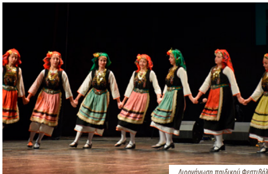
Διοργάνωση παιδικού Φεστιβάλ